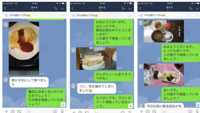
食事表LINEでチェック